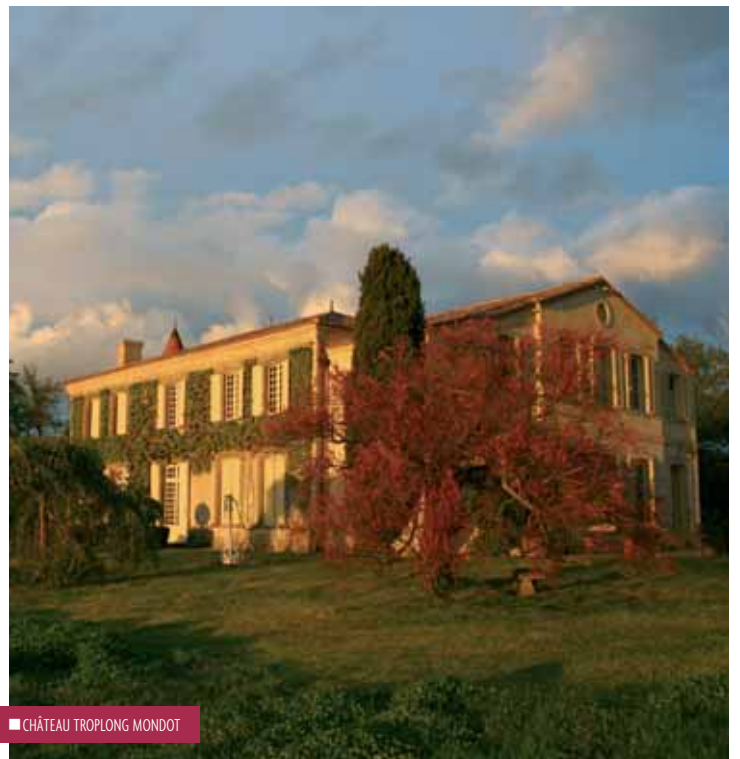
■ CHÂTEAU TROPLONG MONDOT

Le problème qui se pose, ce n'est pas tant les déclassés, les reclassés, ou les mouvements d'assiettes foncières, qui pourraient, effectivement, légitimement, faire débat, mais plutôt ce que ce nouveau classement a de déstabilisant dans l'inconscient collectif et commercial